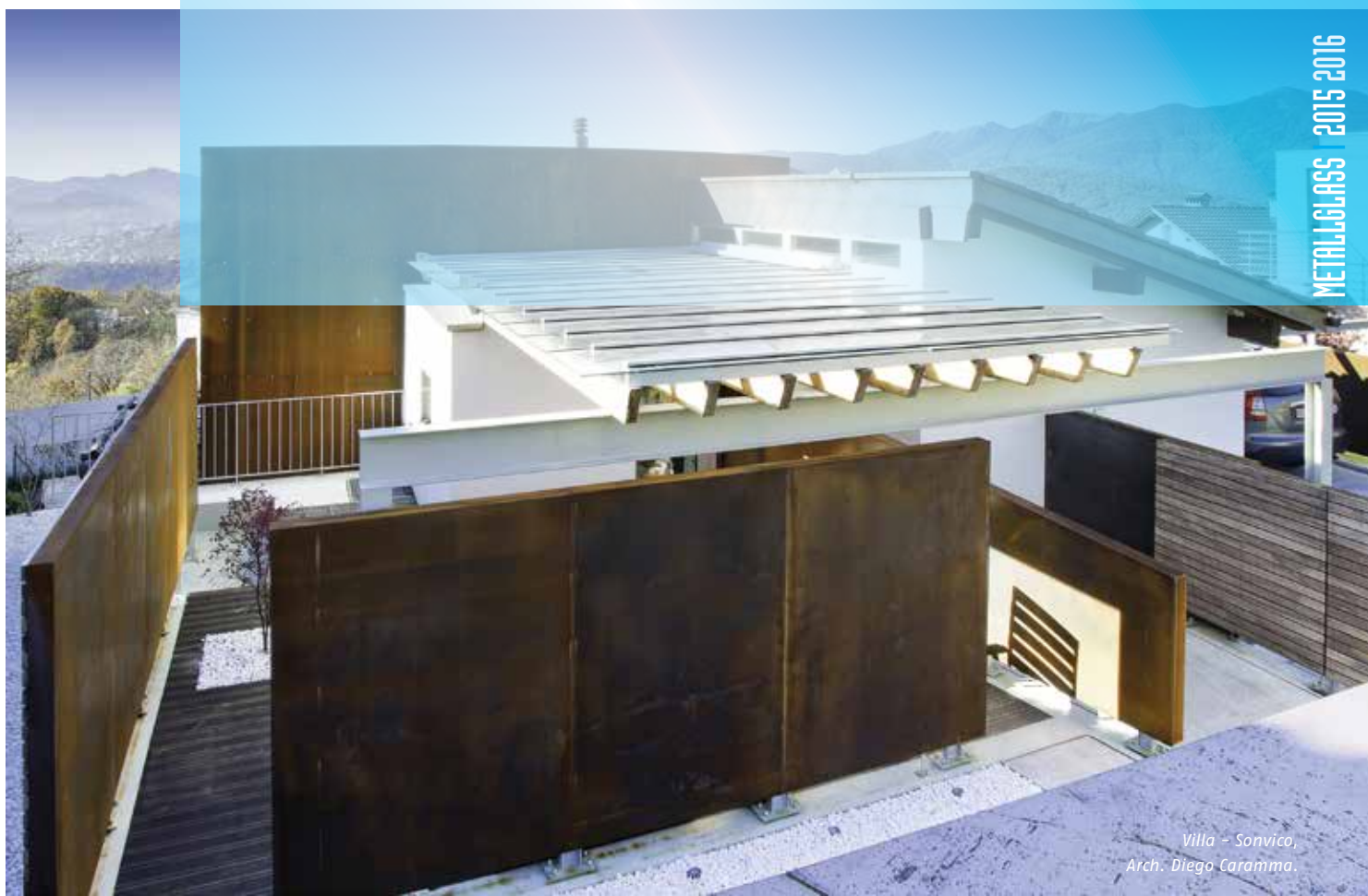
Villa - Sonvico, Arch. Diego Caramma.

È indiscutibile, come scritto anche da importanti economisti, che il benessere e la crescita futura del paese sta anche in una corretta valorizzazione delle capacità delle piccole e medie imprese che rimangono e rimarranno elemento essenziale del tessuto economico e che sempre più spesso oggi vengono trascurate e dimenticate.